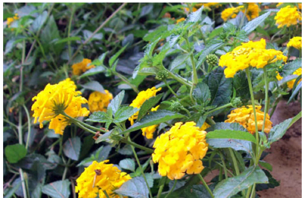
LANTANA CAMARA - MINI LANTANA COR: AMARELA