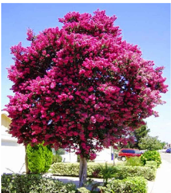
LAGERSTROEMIA INDICA - RESEDÁ