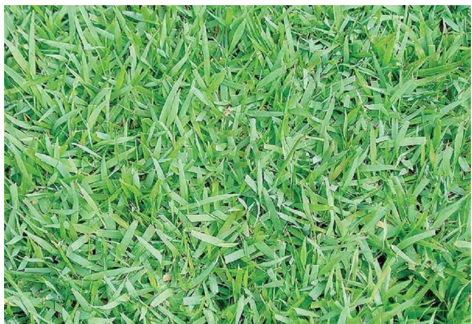
ZOYSIA JAPONICA - GRAMA ESMERALDA