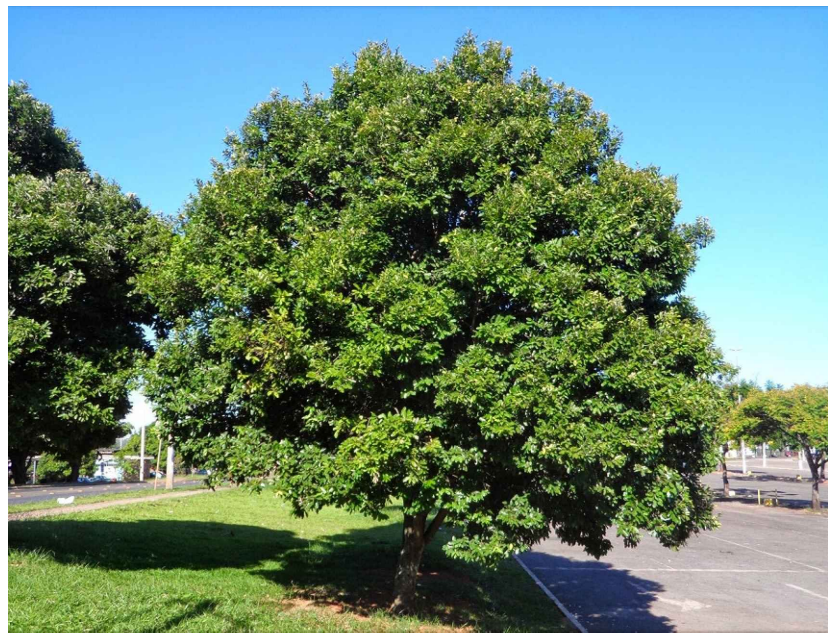
LICANIA TOMENTOSA - OITI